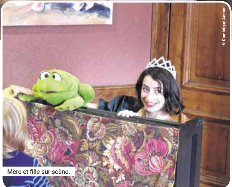
Mère et fille sur scène.